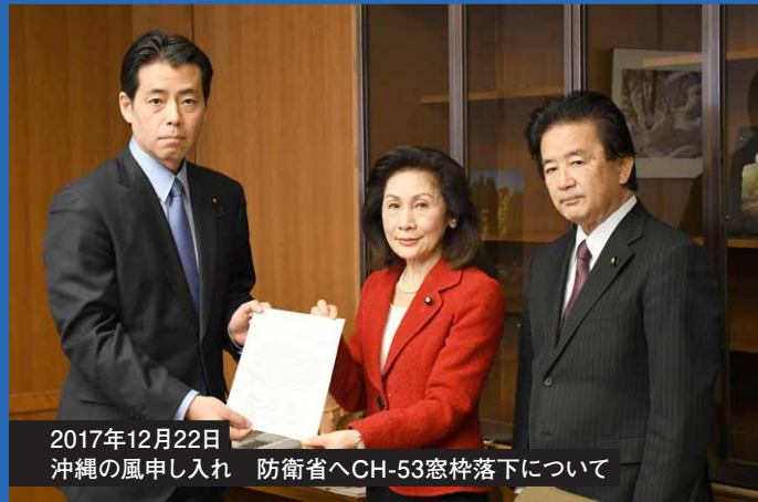
2017年12月22日 沖縄の風申し入れ 防衛省へCH-53窓枠落下について