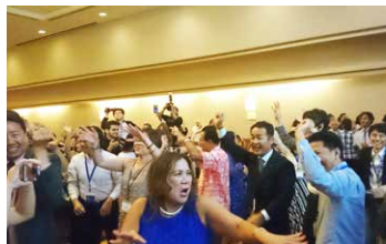
祝賀会でカチャーシー