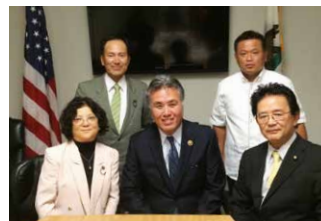
マーク・タカノ下院議員