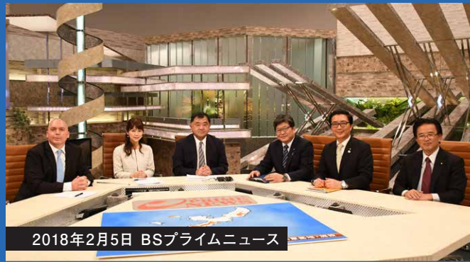
2018年2月5日 BSプライムニュース