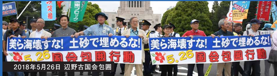
2018年5月26日 辺野古国会包囲