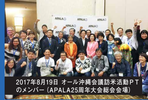
2017年8月19日 オール沖縄会議訪米活動PTのメンバー (APALA25周年大会総会会場)