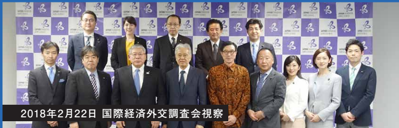
2018年2月22日 国際経済外交調査会視察