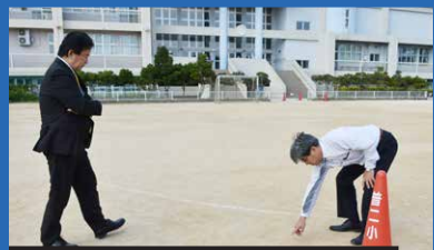
2017年12月14日 普天間第二小学校 米軍ヘリによる窓枠落下事故現場視察