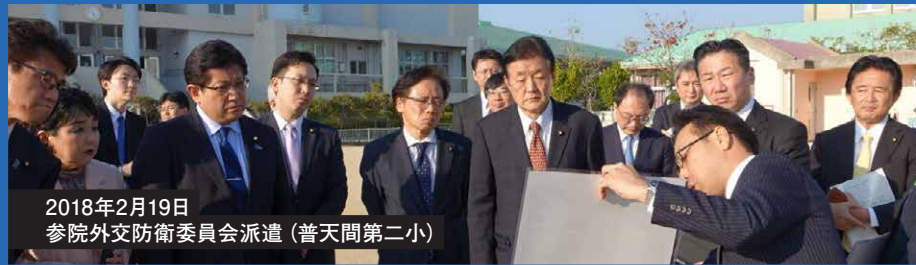
2018年2月19日 参院外交防衛委員会派遣 (普天間第二小)