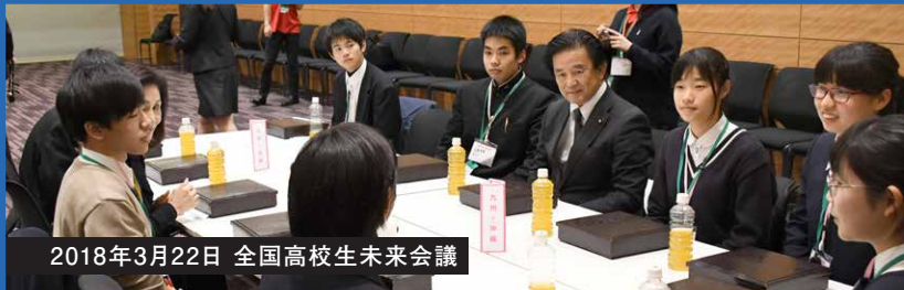
2018年3月22日 全国高校生未来会議