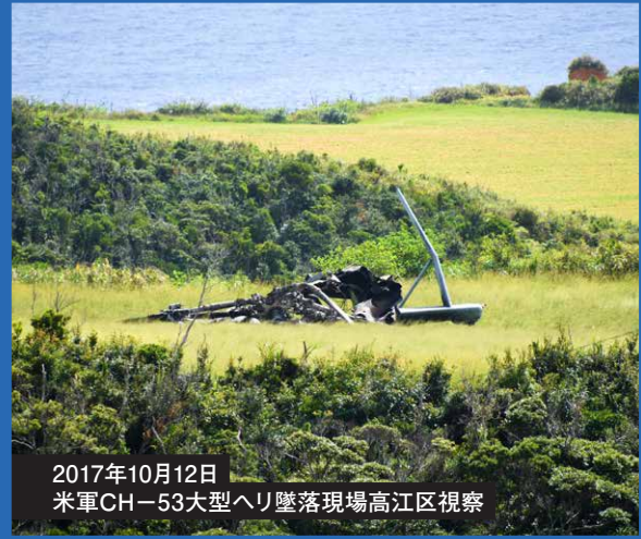
2017年10月12日 米軍CH-53大型ヘリ墜落現場高江区視察