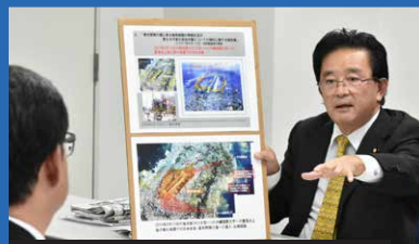
2017年12月14日 緑ヶ丘保育園 部品落下抗議要請 (沖縄防衛局)