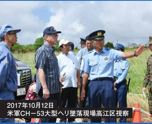
2017年10月12日 米軍CH-53大型ヘリ墜落現場高江区視察