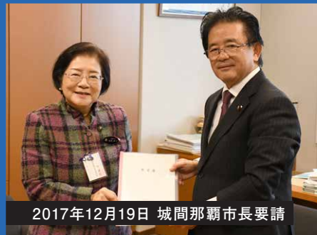
2017年12月19日 城間那覇市長要請