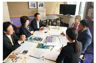
バーバラ・リー下院議員事務所

国会議員・県議団を私と糸数慶子議員の2グループに分け、17～22日に6名の連邦議会議員事務所を訪ねた。日系のマーク・タカノ下院議員は議員本人が応対、バーバラ・リー事務所は沖縄基地問題の解決に協力すると約束してくれた。働きかけを継続していくことが大切だと感じた。今後も米国連邦議会や労働組合、平和団体、環境団体などへ働きかけていきたい。