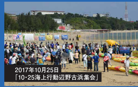
2017年10月25日 「10・25海上行動辺野古浜集会」