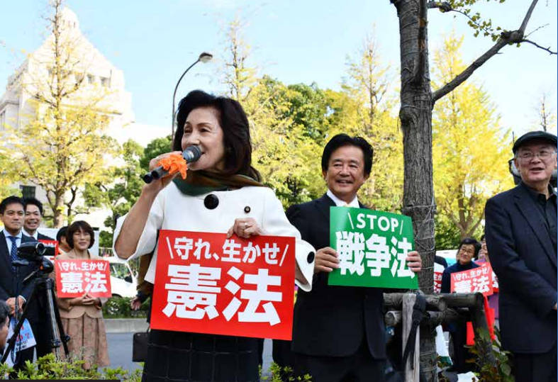
2017年11月1日 安倍9条改憲を許さない! 安倍政権の退陣を要求する11.1国会開会日行動