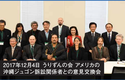
2017年12月4日 うりずんの会 アメリカの沖縄ジュゴン訴訟関係者との意見交換会