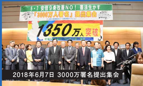
2018年6月7日 3000万署名提出集会