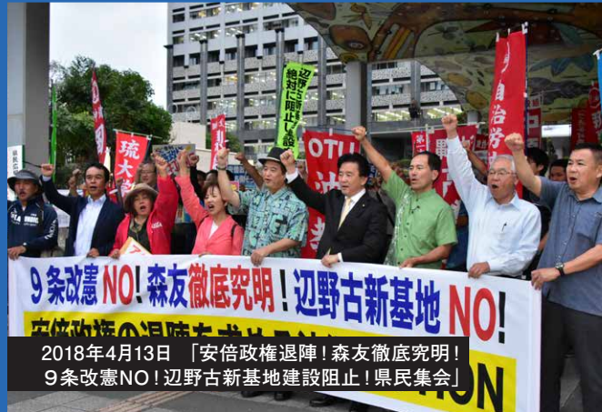
2018年4月13日 「安倍政権退陣! 森友徹底究明! 9条改憲NO! 辺野古新基地建設阻止! 県民集会」