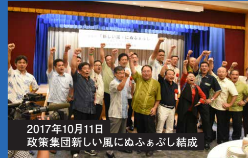
2017年10月11日 政策集団新しい風にぬふあぶし結成