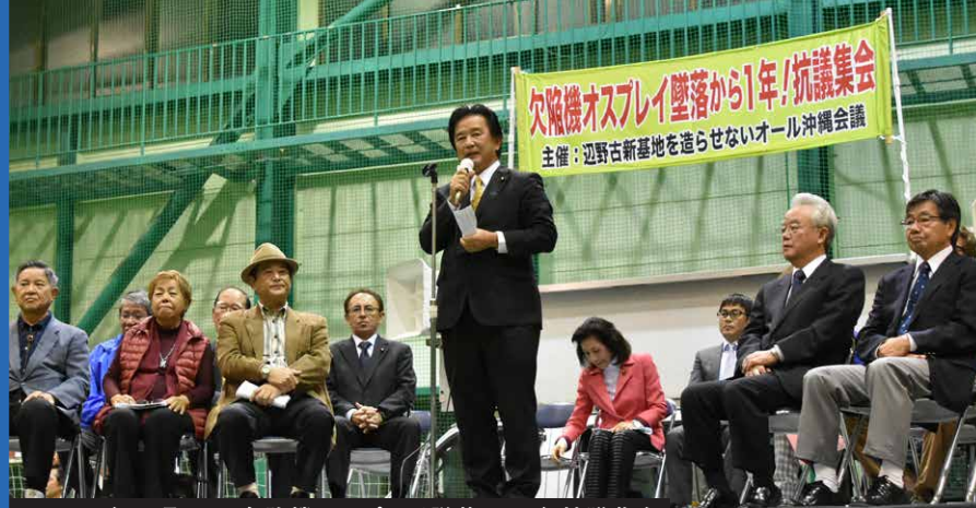
2017年12月15日 欠陥機オスプレイ墜落から1年抗議集会