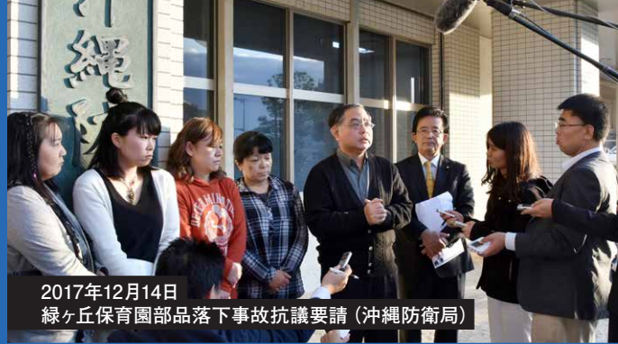
2017年12月14日 緑ヶ丘保育園部品落下事故抗議要請 (沖縄防衛局)