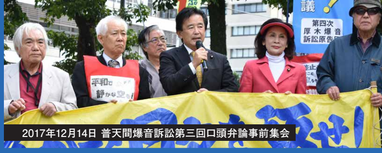
2017年12月14日 普天間爆音訴訟第三回口頭弁論事前集会