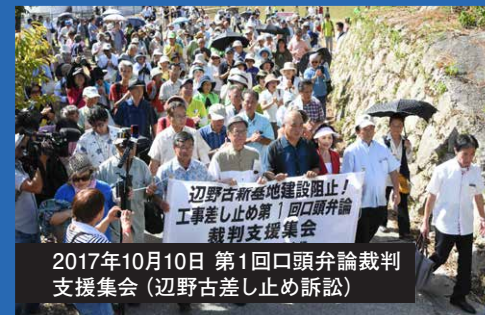
2017年10月10日 第1回口頭弁論裁判支援集会 (辺野古差し止め訴訟)