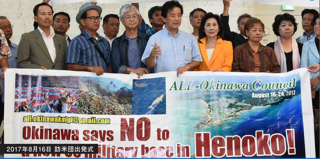
2017年8月16日 訪米団出発式