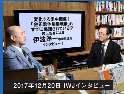
2017年12月20日 IWJインタビュー