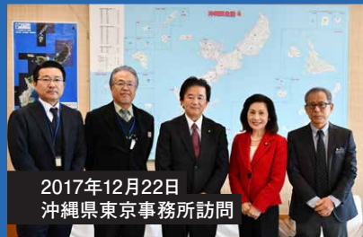
2017年12月22日 沖縄県東京事務所訪問