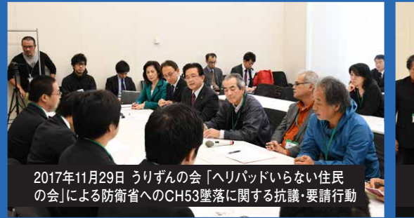
2017年11月29日 うりずんの会「ヘリパッドいらない住民の会」による防衛省へのCH53墜落に関する抗議・要請行動