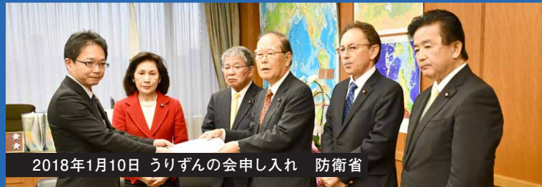
2018年1月10日 うりずんの会申し入れ 防衛省